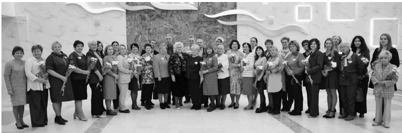
Гости праздничного вечера

Во Дворце детского и юношеского творчества Нижнего Тагила состоялась презентация необычного проекта «Живая книга», инициатором которого выступила городская организация Общероссийского Профсоюза образования. «Живая книга» - видеоальманах, состоящий из интервью лучших представителей педагогического сообщества. Первые съемки прошли еще в 2010 году. За минувшие годы удалось создать уникальную коллекцию высказываний об учителе, его миссии и будущем школы.