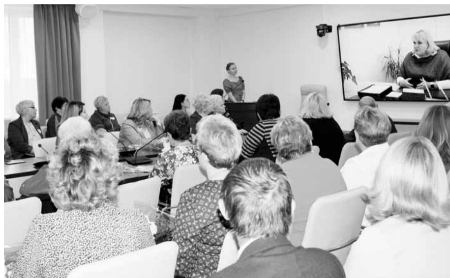
Внимание на экран

«Проект уникальный, - говорит директор Нижнетагильского музея-заповедника Эль-