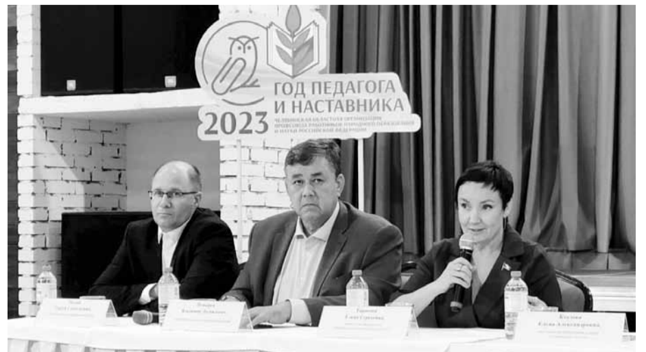
Разговор без галстуков

В дискуссии коснулись единого содержания рабочих программ общего образования,