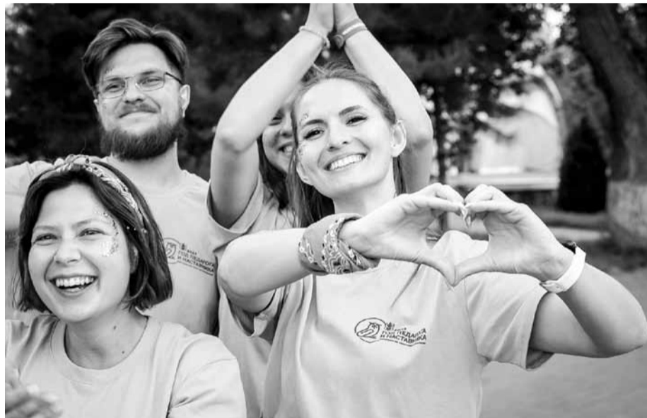
На открытии форума

Начинающие специалисты встретились на волгоградской земле