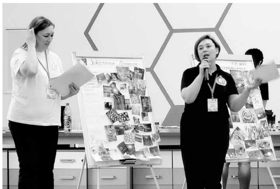
Подведение итогов брифинга