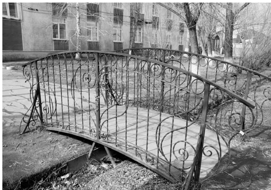
Мост в центре Черлака