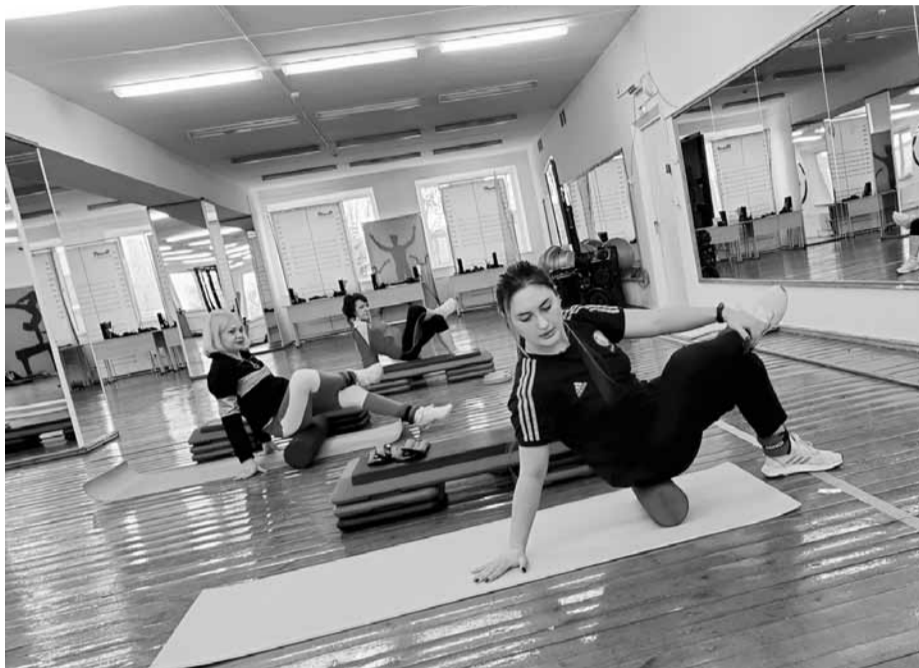
Тренировки становятся привычным делом для педагогов