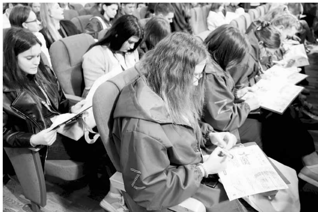
Участники форума написали диктант по истории Сталинградской битвы