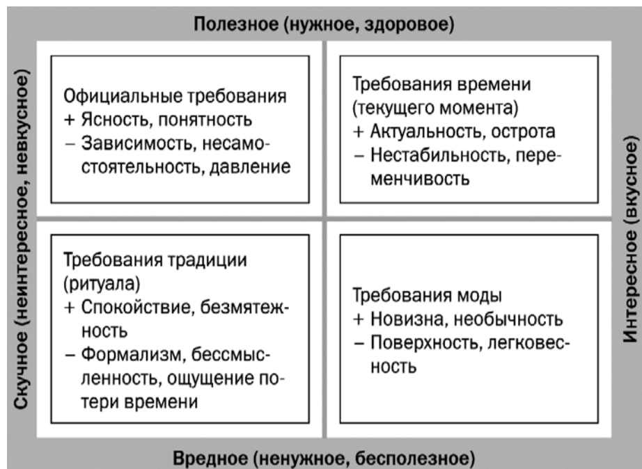
Схема 2. Отношение к информации

Отношение к информации зависит от целеполагания, конкретной темы и содержания, наличия или отсутствия технического сопровождения, особенностей обучающихся и подготовленности самого педагога, государственных требований и общественных запросов к системе образования. Ориентироваться непросто, но рекомендуется учитывать две основные линии координат (несомненно, на практике их значительно больше, но в данном случае выбрано сознательное упрощение), что показано на схеме 2.