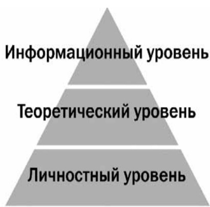
Схема 1. Уровни освоения информации на занятии

Личностный результат - анализ и оценка работы на занятии, аксиологическая (ценностная) основа полученных фактов и сведений.