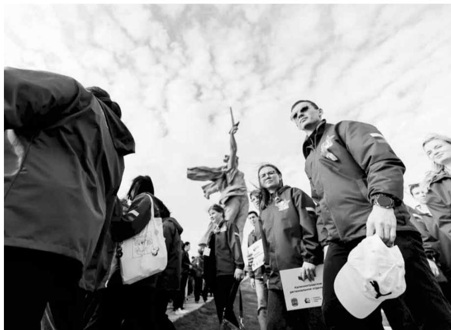
У подножия памятника «Родина-мать»

- Мы подводим итоги форума в особом месте, где происходит много знаковых событий. Это вдохновляет, мобилизует. В