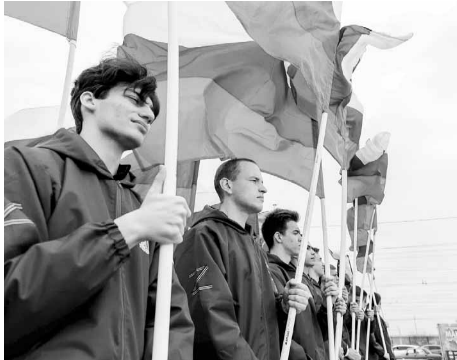
Знаменосцы перед восхождением на Мамаев курган

- Ценность форума в том, что он объединил очень многих людей, которые заняты сохранением исторической памяти. Форум проходит в год празднования 80-летия Сталинградской победы, которая определила не только исход Великой Отечественной войны, Второй мировой войны, но и миро-