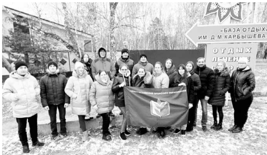
Фото на прощание

Федерацией омских профсоюзов и прошла в сентябре. Коллеги поделились своими впечатлениями, рассказали, как можно применить практики школы профлидера в деятельности первичной профсоюзной организации.