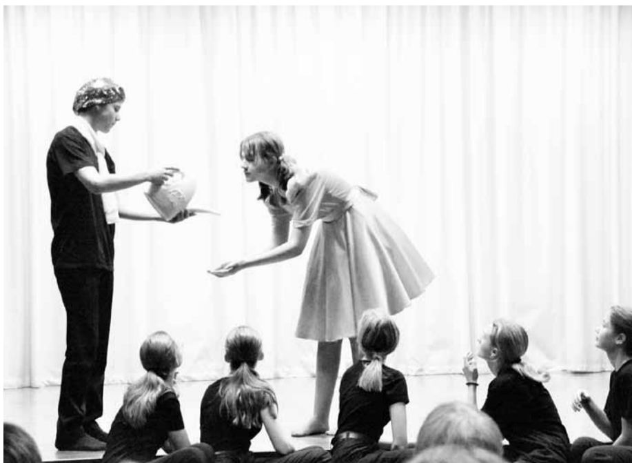
Юные артисты играют «Маленького принца»