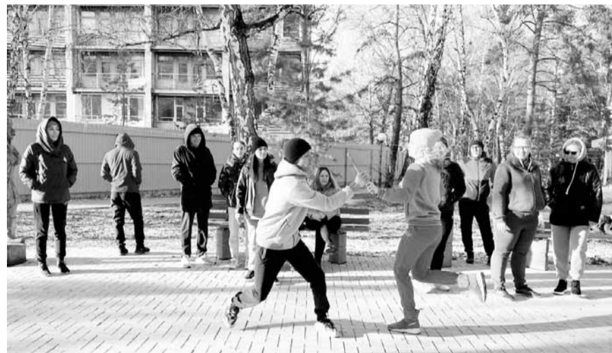
Спортивные состязания на свежем воздухе

Молодые специалисты провели два дня в движении и с пользой