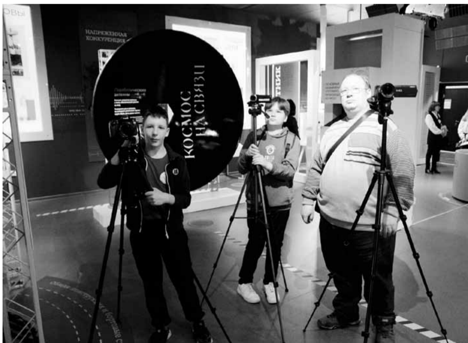
Детская студия АтомТВ за съемкой репортажа