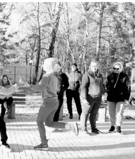
Фото на прощание

Закончился день игрой в бильярд и неформальными разговорами в кругу друзей. Старшим коллегам было чем поделиться с молодежью, которая только начинает педагогический путь. Я вспомнил немало интересных случаев из своей многолетней практики учителя-предметника и классного руководителя и, конечно, рассказал о работе профсоюзного лидера. Ребята, входящие в команду «Мо-