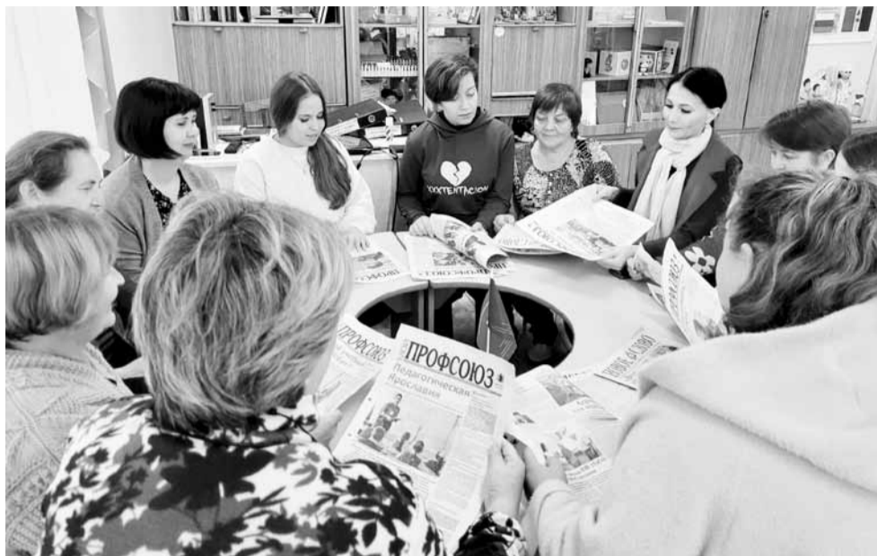
День профсоюзной информации в детском саду №49 Нижнекамска