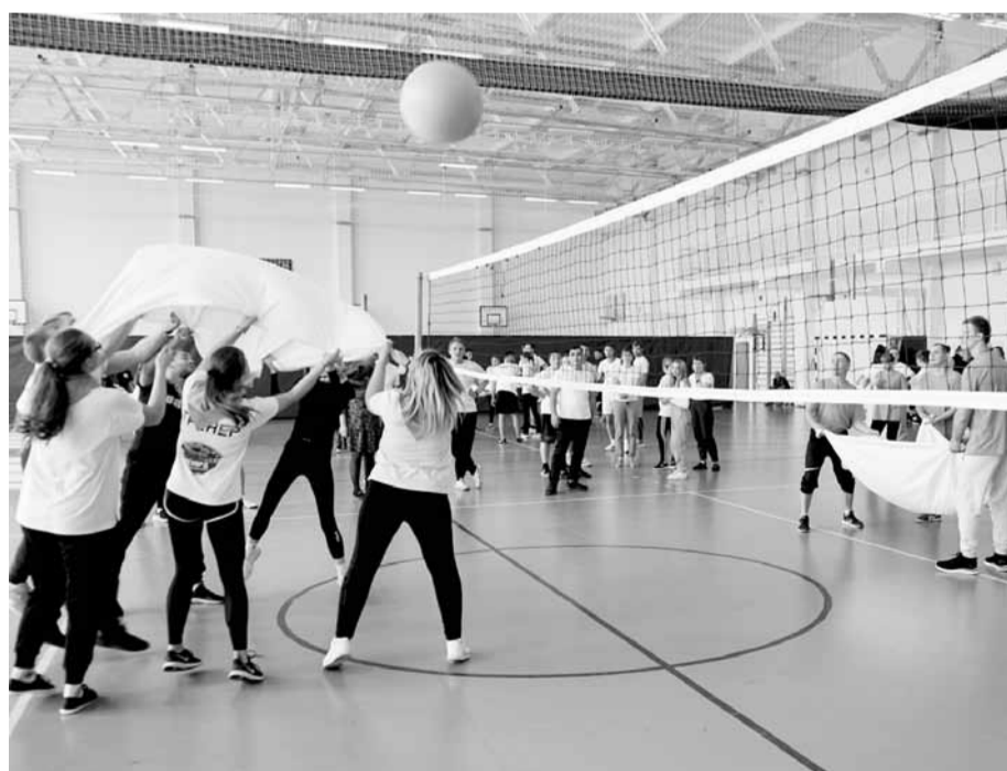
Простынобол - это весело!

Церемония открытия началась с торжественного парада делегаций. 7 команд, 56 участников. В этом году северо-западный профсоюзный округ области представляли Чановский и Венгеровский районы - команда «Напролом». От центрального округа выступал «Феникс» из Коченевского района. В состав «Той еще горчицы» вошли все районы юго-западного округа: Баганский, Карасукский, Кочковский, Краснотуркменский, Купинский. Восточный округ - «Медведи» - объединил Мошковский, Болотнинский, Новосибирский, Тогучинский районы и город Обь. Педагоги из центрального округа, Кировского, Дзержинского, Октябрьского и Ленинского районов Новосибирска образовали «Единство». Из южного округа приехала «Убойная сила» - педагоги города Искитима и Искитимского района. И впервые заявила о себе молодежь учреждений среднего профессионального образования - «Профтех».