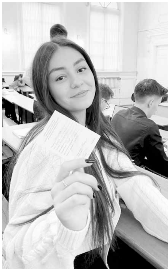
Студенческую первичку Казанского федерального университета дополнили 3 тысячи первокурсников

профсоюза. «Задача акции - как можно шире проинформировать общество о деятельности профсоюзов и вовлечь работников, школьников и студентов в активную общественную жизнь», - говорит она.