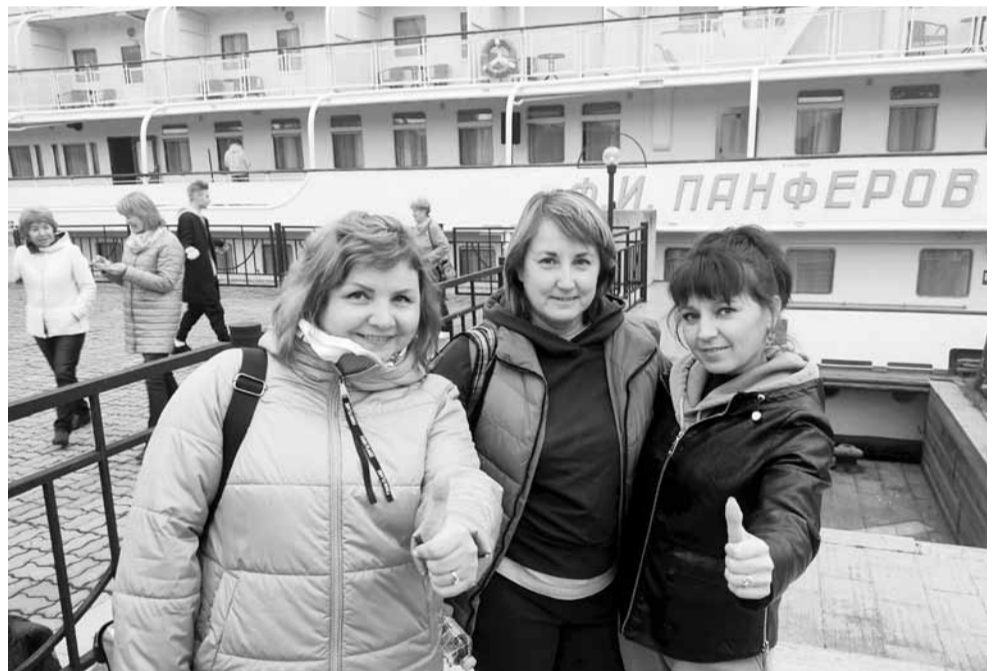
Для профактива Авиастроительного и Ново-Савиновского районов Казани провели семинар на борту теплохода