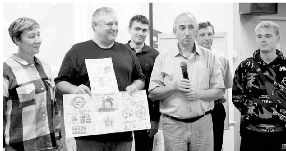
Презентация правил безопасной работы