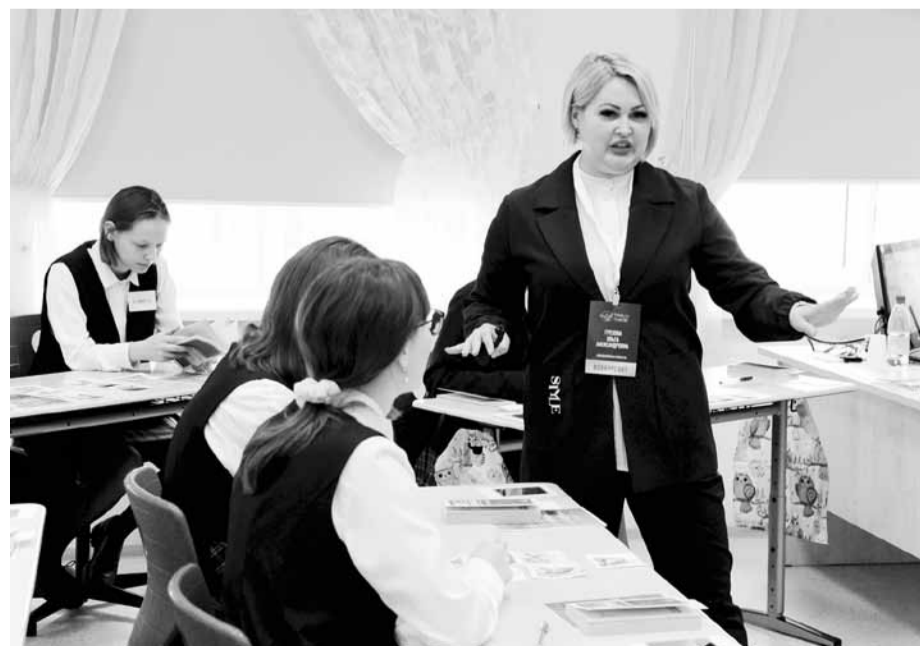
Уроки: учатся школьники, учится жюри

так знаменательно в 33-летие конкурса «Учитель года России».