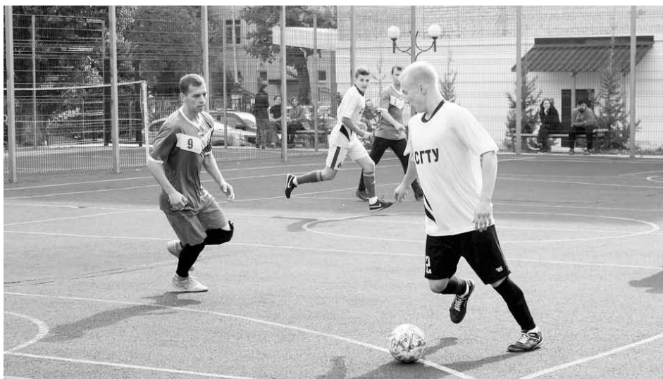
Соревнования по мини-футболу

- Занимаюсь уже пятый год, стала лучше себя чувствовать. Особенно люблю ходить, когда на улице дождь или туман. Малолюдно, можно не отвлекаться и сосредоточиться. Это как медитация. Возникает ощущение полета!.. Соседки по дому, глядя на меня, тоже обзавелись палками. «Будешь, - говорят, - нашим тренером».