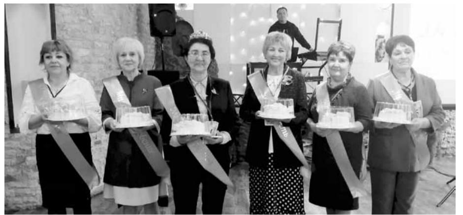
Участницы конкурса «Красота элегантного возраста плюс-минус 60»

Руководители ассоциаций педагогов-ветеранов из Новобурасского и Базарно-Карабулакского районов вкратце рассказали, какую работу проводят на местах с представителями старшего поколения. При выходе