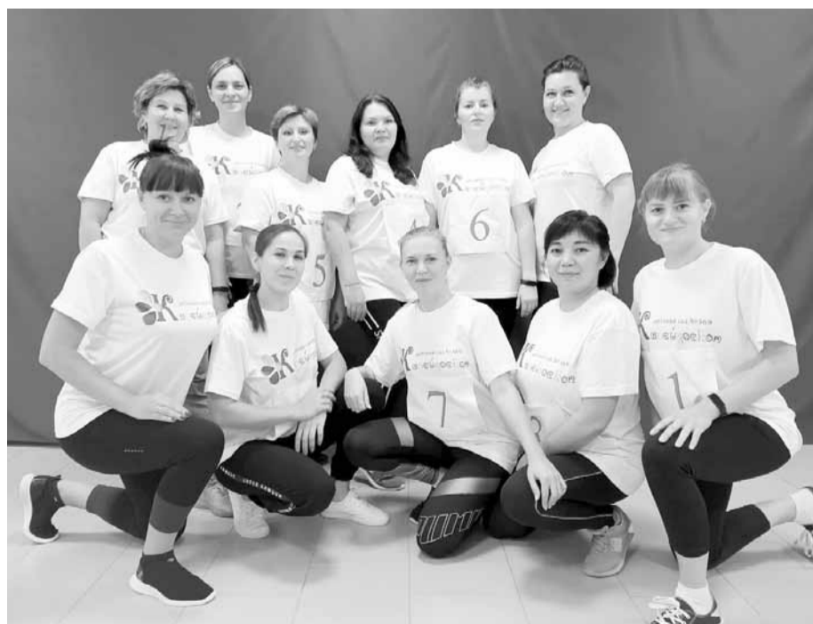
Сотрудники детского сада №369 «Калейдоскоп» Новосибирска

Девчата к здоровому образу жизни сами привыкли и мужей своих стали подтягивать, по выходным семьями собираться, да в волейбол играть. Так натренировались, что второе место по волейболу в Ленинском районе заняли среди профсоюзных организаций системы образования. Мячик себе в сад решили новый купить, теперь, наверное, за первым местом пойдут. А недавно еще и теннисный стол приоб-