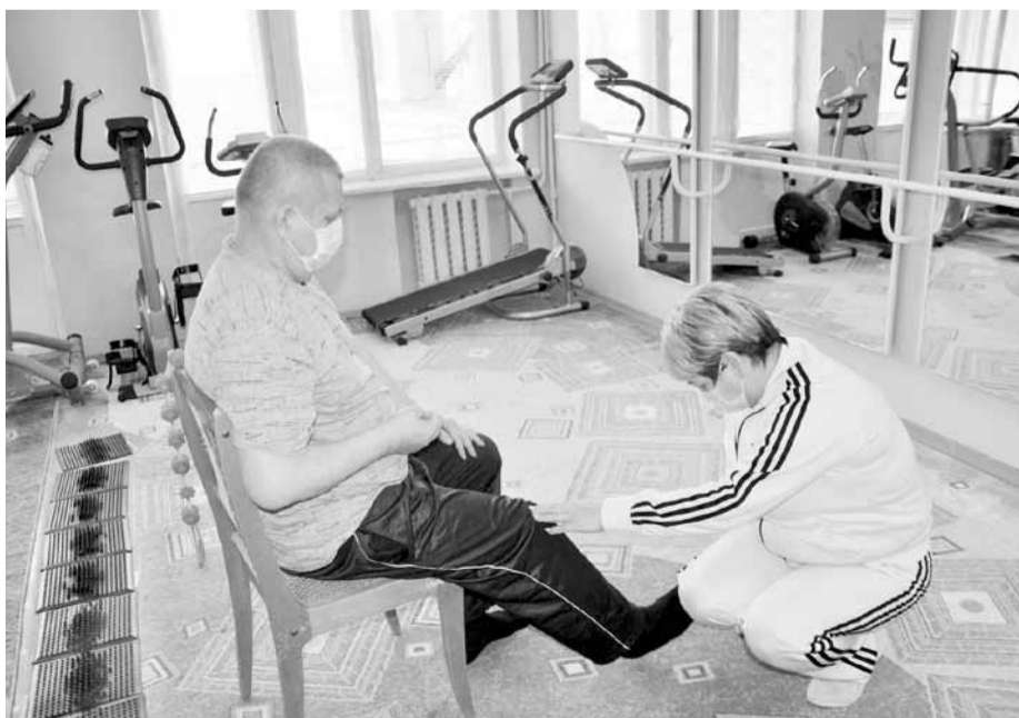
Занятие с участием инструктора по лечебной физкультуре