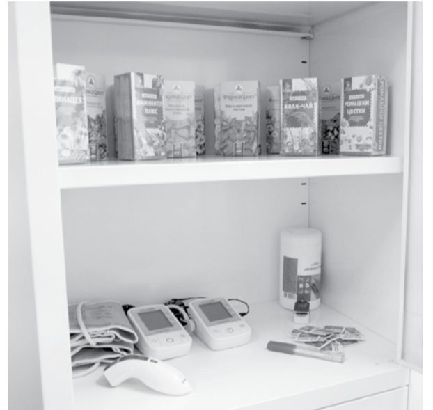
Выбираем фиточай на свой вкус

- С 2020 года администрация и первичная профсоюзная организация со-