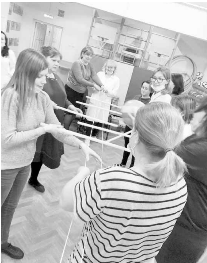
Так проходит «Вечерний тимбилдинг» - корпоративные игры на командообразование

Творческий тимбилдинг - это максимальный простор для креатива, каждый может проявить себя и, возможно, открыть новые таланты. К юбилеям коллег и праздникам мы готовим авторские творческие номера, что придает таким концертам особую душевность и искренность. Сейчас,