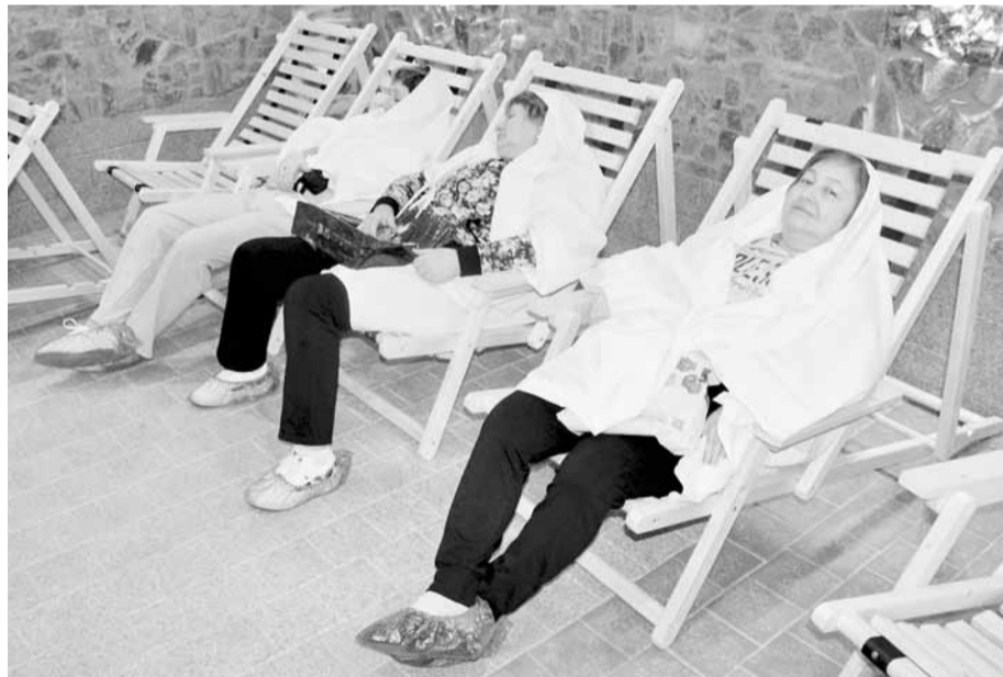
В соляной пещере

Знаменитый воронежский санаторий проводит у себя масштабную модернизацию